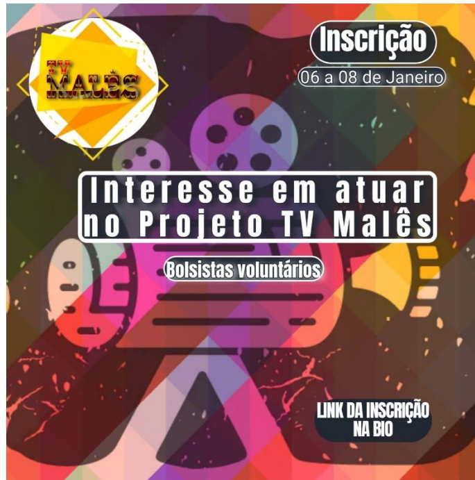
Card publicado nas redes sociais para divulgação de seleção de bolsistas